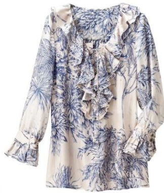
◆エリカ ボタニカルプリント ラッフルフリルブラウス