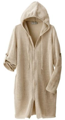
◆擬麻コットン ロングパーカー