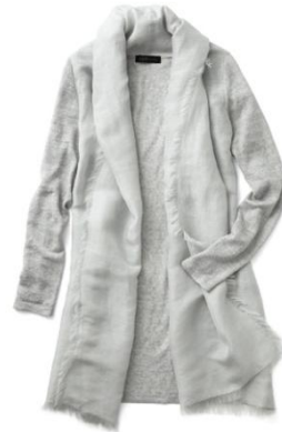
◆メランジ リネンニット ロングカーディガン