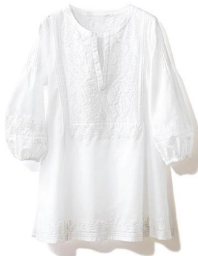
◆ベトナム刺繍 カフタンチュニック