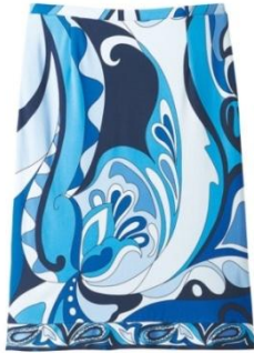
◆シルクジャージー パネルペイズリースカート