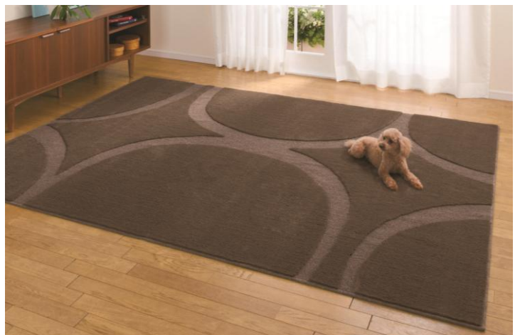
【写真上】『ディノス ウィズ』2012-2013 冬号より《ディノス企画商品》

（※1）『dinos with』2012-2013冬号 2012年10月1日～2012年11月22日 敷物カテゴリー売上金額 （※2）同カタログ 2012年10月1日～2012年11月22日 カーテンカテゴリー売上金額