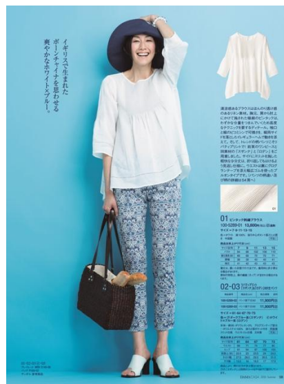
(写真下) 「スザンナ」柄

(モデル着用写真) 「ロデン」柄 ◆リバティプリント 「スザンナ」 & 「ロデン」9分丈パンツ (股下 60cm) 11,500円(税込) http://www.dinos.co.jp/p/1301603485/ ※その他、股下 65cm もあります